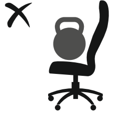
НЕ ПРЕВЫШАТЬ ДОПУСТИМЫЙ ВЕС