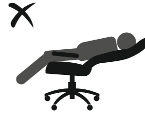
НЕ ОПИРАЙТЕСЬ НА СПИНКУ