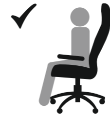
СИДИТЕ НА ВСЕМ СИДЕНИИ