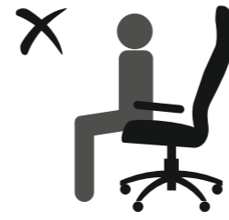
НЕ СИДИТЕ НА КРАЮ