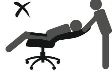
НЕ ОПИРАЙТЕСЬ НА СПИНКУ