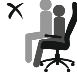
КРЕСЛО НЕ РАССЧИТАНО ДЛЯ ДВОИХ ЛЮДЕЙ!