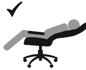
ВЕС ДОЛЖЕН БЫТЬ РАСПРЕДЕЛЕН НА ВСЕ СИДЕНЬЕ